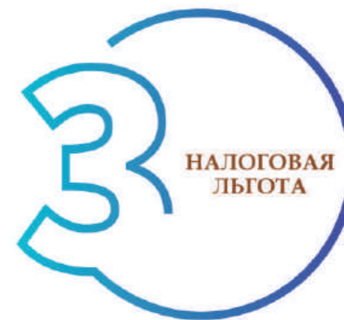
ШАГ 3. ОПРЕДЕЛЕНИЕ НАЛОГОВОЙ ЛЬГОТЫ