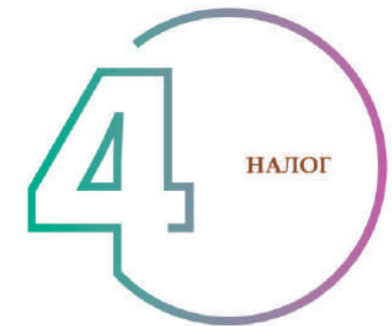
ШАГ 4. РАСЧЕТ НАЛОГА