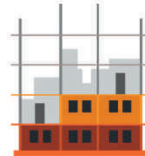
ОБЪЕКТ НЕЗАВЕРШЕННОГО СТРОИТЕЛЬСТВА