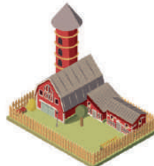
ЕДИНЫЙ НЕДВИЖИМЫЙ КОМПЛЕКС