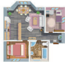
КВАРТИРА (ЧАСТЬ КВАРТИРЫ, КОМНАТА)