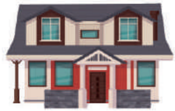
ЖИЛОЙ ДОМ (ЧАСТЬ ЖИЛОГО ДОМА)