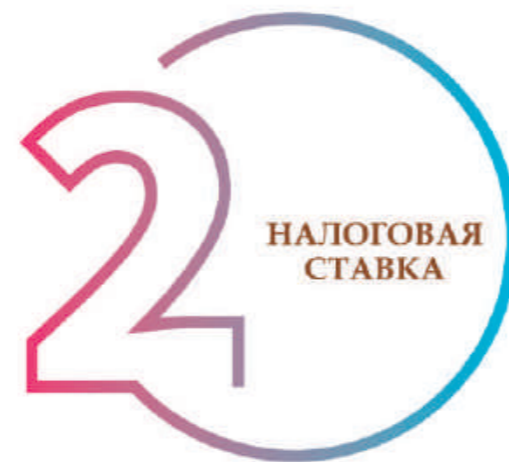
ШАГ 2. ОПРЕДЕЛЕНИЕ НАЛОГОВОЙ СТАВКИ