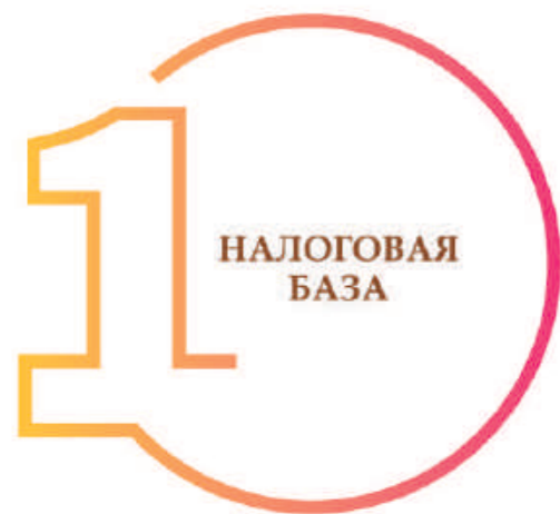
ШАГ 1. ОПРЕДЕЛЕНИЕ НАЛОГОВОЙ БАЗЫ